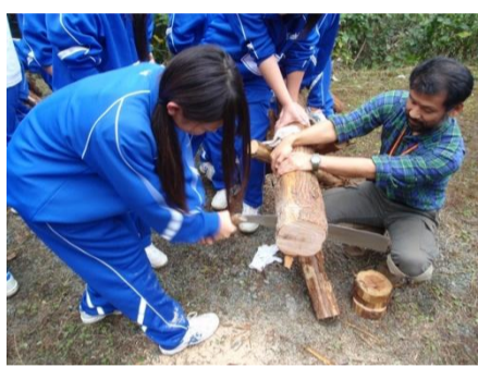
クラス対抗丸太切り大会の様子

十一月十一日(金)、二学年による菊池高校育友会林体験学習が行われました。国道から育友会林へ