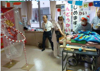
玉はどこに入った?

初めての運動会です。授業としては、初めてICUから出ての活動ということもあり、ちょっと緊張した様子もありましたが、先生や先輩たちと一緒に競技に参加することができました。他学部の生徒や先生たちも応援に駆けつけてくださり、大いに盛り上がった運動会となりました。(今村郁巳)