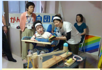
俊君、スイッチオン!

今年の訪問教育は、5月25日(水)にくまもと芦北療育医療センターの110号室で「平成23年度運動会訪問教育の部」を行いました。その中で、7人の児童生徒は「まんなかねらえ!玉入れ!」と「おおものねらえ!魚釣り!」の2競技に取り組みました。小学1年生の二人にとっては、